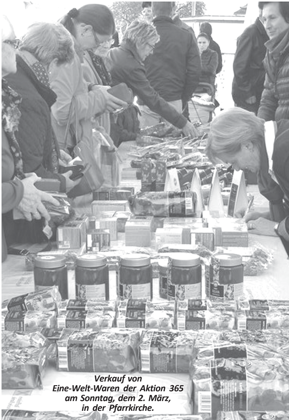
Verkauf von Eine-Welt-Waren der Aktion 365 am Sonntag, dem 2. März, in der Pfarrkirche.